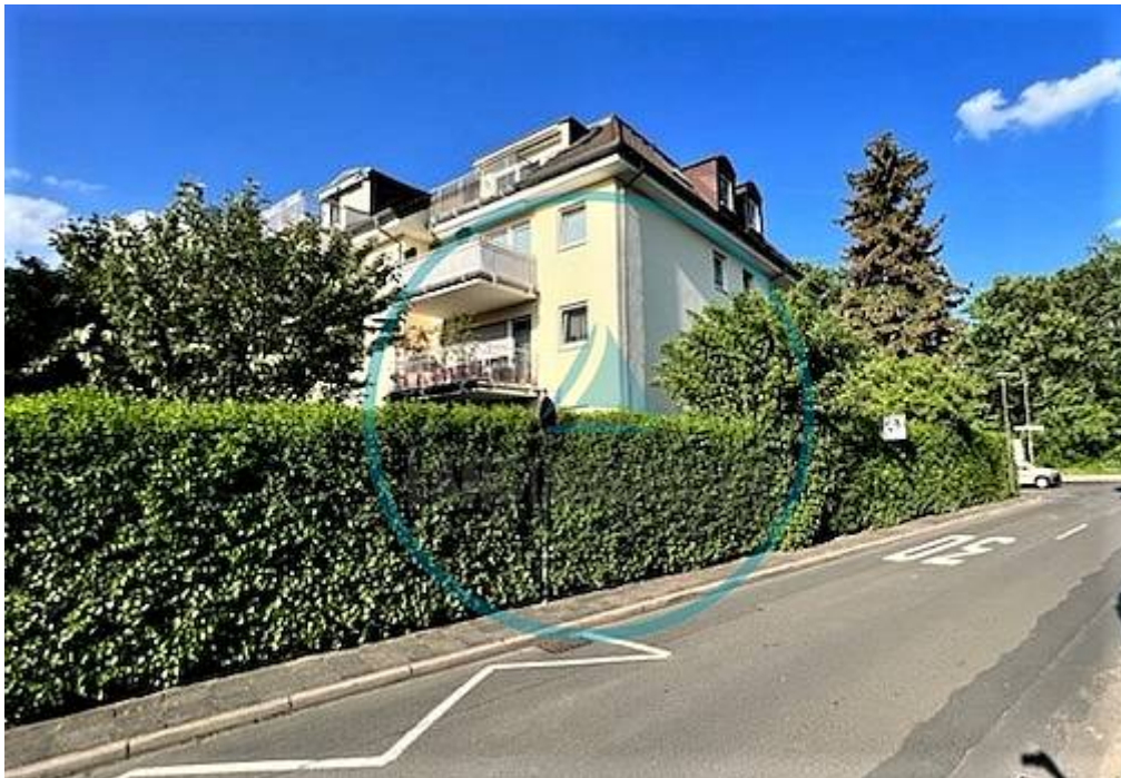
Blick zum Haus